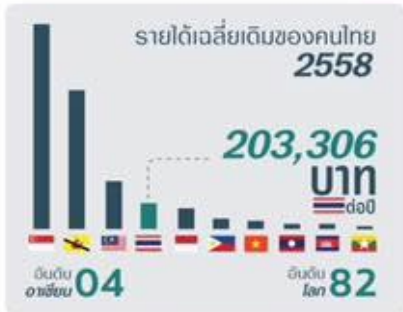
Source : Office of National Economic and Social Development Board, 15 August 2016